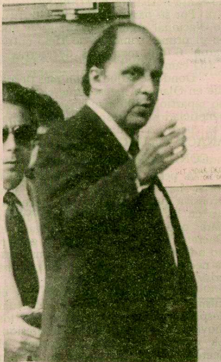
John D. Negroponte.